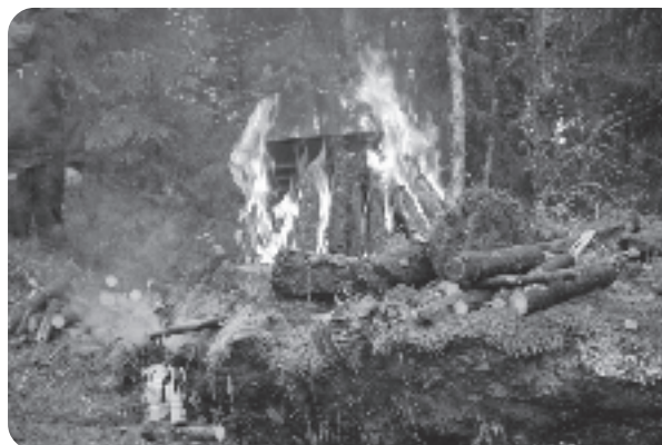
Tjärbränning i Abborrsjön.