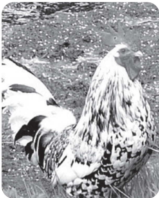
En Glad-Påsk tupp