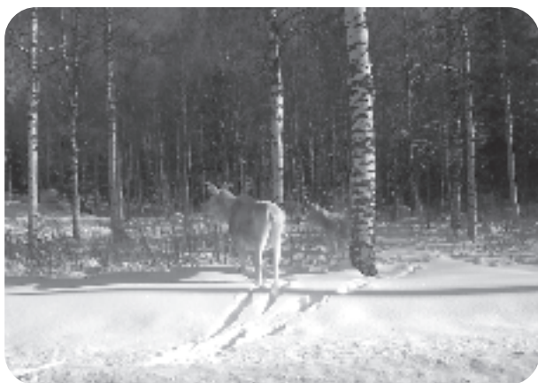
Detta foto av en vit älgko med kalv i Kolstan togs av Lars Dahl, Bortan.