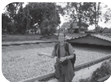
Brev från Colombia