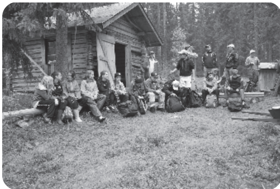
Järvenskolan klass 6 på studiebesök i Abborsjön