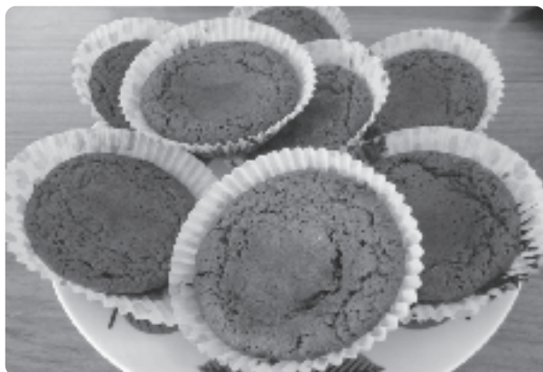
Kladdkaka i muffinsform.

Serveras ljummen med vispad grädde eller vaniljglass. Apelsin, jordgubbar och kiwi (efter säsong) är också gott att servera till.