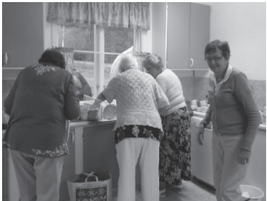
Många händer behövs det